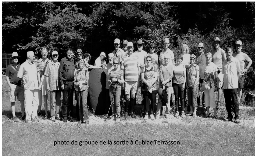
photo de groupe de la sortie à Cublac Terrasson